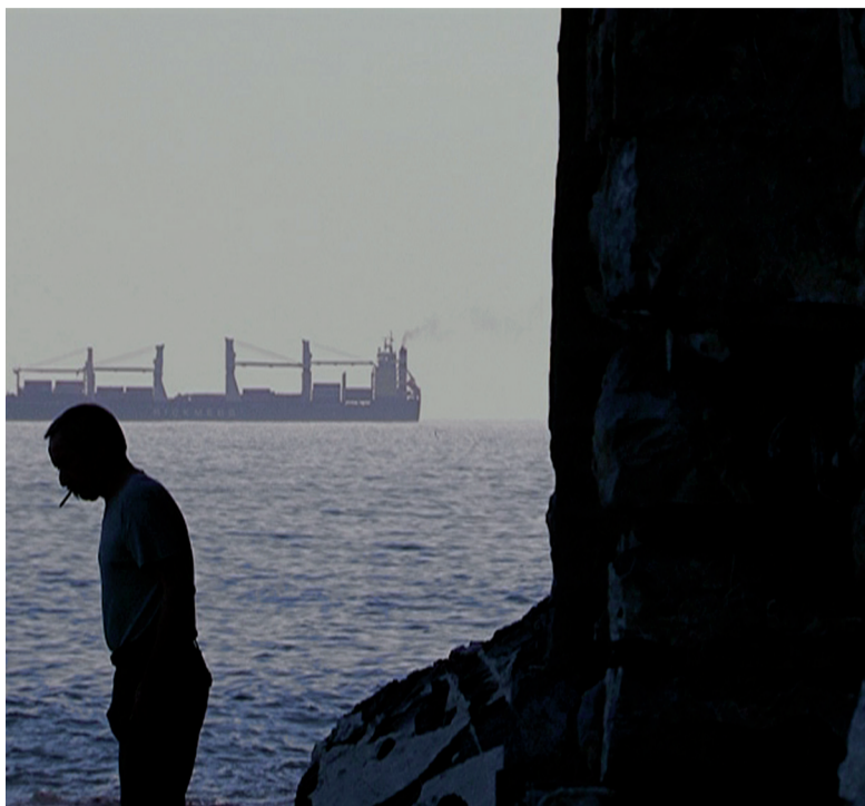
La bocca del lupo - Sabato 27 ore 20.30

Durante il festival, in sala Mastroianni e sala Scorsese, saranno proiettati i nuovi episodi di: BRUSTULEIN. CINEMA DA SGRANOCCHIARE AL CINEMA (Italia/2009) di Davide Rizzo. Un secolo di storia all'interno delle sale cinematografiche in brevi pillole da sgranocchiare una dopo l'altra. Una raccolta di testimonianze orali, di ricordi delle vecchie generazioni, con particolare riferimento al rapporto fra la vita vissuta e il cinema: tutto quello che accadeva nelle "sale buie", i cinema più brutti della città, i più bei film, gli amori, i tradimenti. Format audiovisivo ideato per "sale da cinema" come divertente e curioso intermezzo tra le proiezioni, costituisce un'istantanea sugli usi e costumi nei cinematografi del secondo dopoguerra.