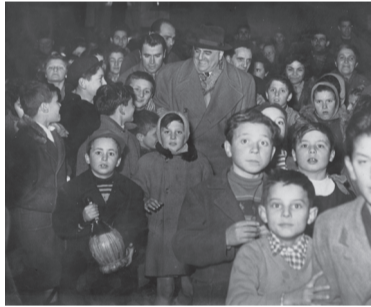
La febbre del fare, Bologna 1945 – 1980