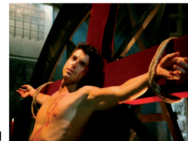
L'ispettore Coliandro 3 - 666