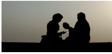
Il nemico interno. Musulmani a Bologna

V.O.S. IT. In un paese in guerra, alla caduta del regime talebano, una giovane giornalista afgana decide di fondare Radio Sahar, una radio FM comunitaria con l'obiettivo di portare informazione in un paese schiacciato dall'analfabetismo e dalla povertà.