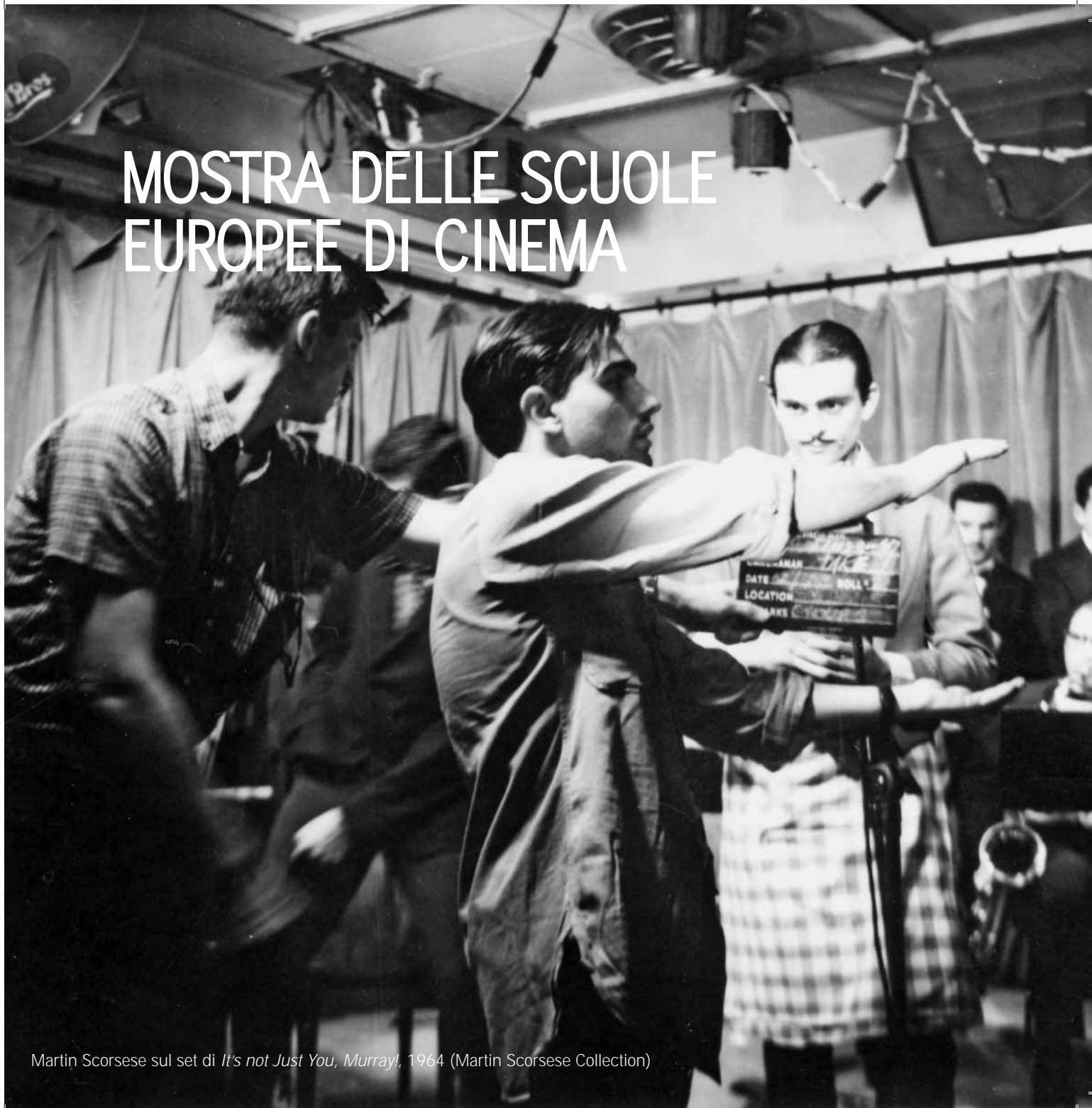
Martin Scorsese sul set di It's not Just You, Murray! , 1964