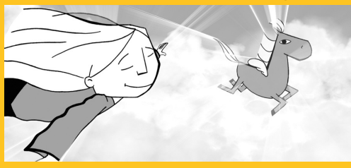
Skyggen i Sara