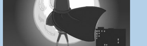
Extraman - Troppa criminalità

22.15 Fare cinema a Bologna. Ricordando gli anni '70 IL POPOLO ALTO (Italia/2004) di Giovanni Ferrara e Roberto Malvagia (Beta, 39') OLTRE LE NUVOLE (Italia/2004) di Antonella Restelli (Beta, 58')