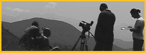
Il mattatoio di Dio (backstage)

22.30 Fare cinema a Bologna IL MATTATTOIO DI DIO. Frammenti ludici di materialismo mistico (Italia/2003) di Federico Nobili (MiniDV, 73') Giovanni Lindo Ferretti presenta l'attività della Bottega Bologna di Musica e Comunicazione creata a Bologna nel giugno 2002, promossa dalla Fondazione Del Monte.